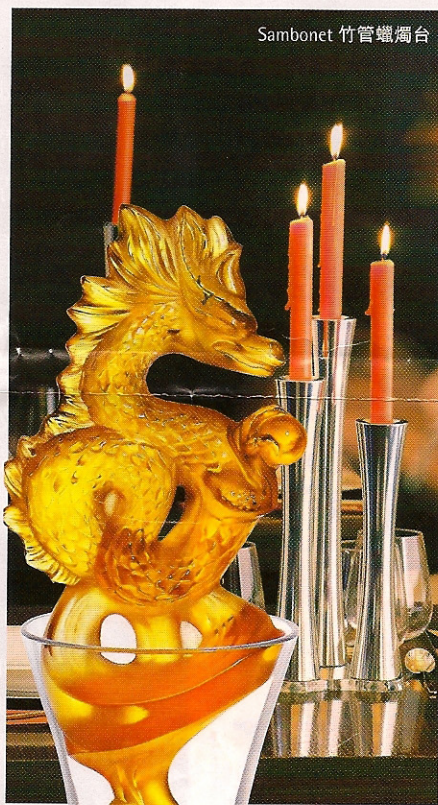
Lalique 2009 年度珍藏版《天龍》酒瓶