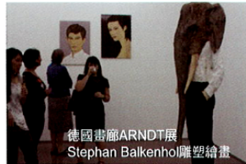
德國畫廊ARNDT展 Stephan Balkenhol雕塑繪畫