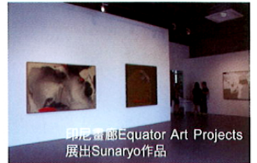
印尼畫廊Equator Art Projects 展出Sunaryo作品

台北還是冷風颼颼的一月中旬，在新加坡正是夏日島嶼風情畫。在《藝術登陸新加坡》舉辦期間，大會在新加坡畫廊區—吉門營房藝術村(Gillman Barracks)精心安排了場露天派對。這一晚，進駐的15間國際藝廊，包括營區內的當代藝術研究中心(CCA-Centre for Contemporary Art)，聯合舉辦開幕酒會，現場熱鬧滾滾。營區內的白氣球路燈像是一輪輪的明月，映照著小路上穿著短袖襯衫與細肩帶洋裝、手拿著酒杯的賓客們，一台台接駁巴士將賓客從濱海灣金沙酒店接來，頓時來往人車川流不息。漫步在吉門營房藝術村之中，彷彿置身熱帶花園，夏夜晚風吹拂，飄送來陣陣樂音，椰子樹影隨風搖動，空氣中有香檳與古龍水的甜味。不經意抬頭看，赫然發現DJ台上戴著耳機認真刮碟的竟是《藝術登陸新加坡》大會總監勞倫佐！正懷疑自己是否在做夢，畫廊小姐已為我敞開玻璃大門，笑盈盈地問道：「您要白酒還是紅酒？」