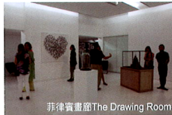
菲律賓畫廊The Drawing Room