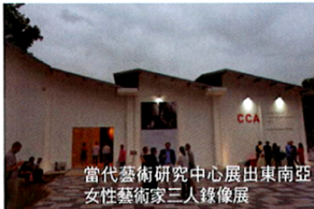
當代藝術研究中心展出東南亞 女性藝術家三人肖像展